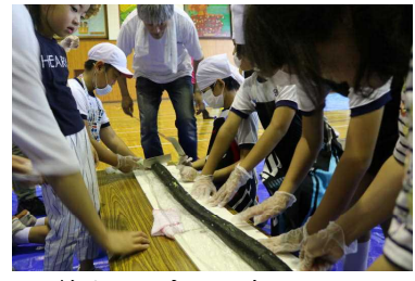
< 6学年行事 > 村岡小 7月1,2日(土日)