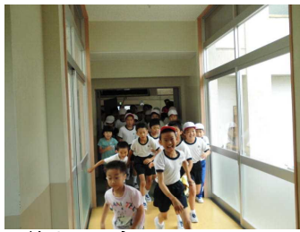
< 5学年行事 > 7月9日(日) 村岡小