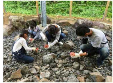
< 2学年行事 > 野外恐竜博物館 6月25日(日)