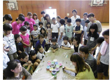
< 3学年行事 > 6月25日(日) 村岡小