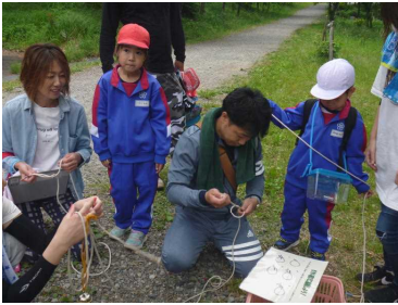
< 1学年行事 > 青少年自然の家 6月28日(日)