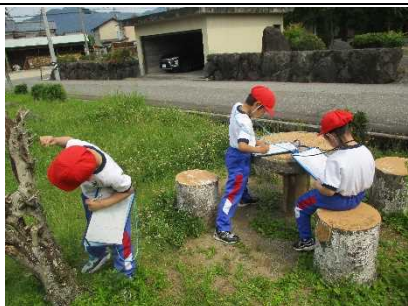
【1年生 やまだ公園へ行く！】