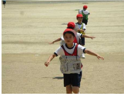
【新聞紙とともに走る！】

★1年 国語「ねことねっこ」 言葉を使った 主語・述語のある正しい文章作り を始めました。