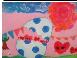
【2年 不思議なたまご】

校舎内は美術ミュージアム 廊下の掲示作品に目が釘付けになります。子供たちの感性は素晴らしいです！