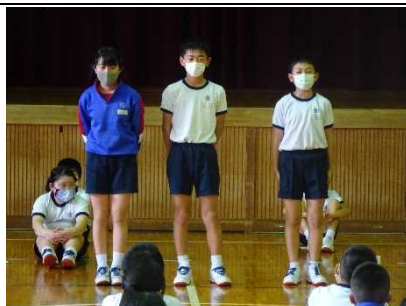
【児童会活動は 任せてください！】

★地域の公園の正しい使い方を知るために 実地調査 へ。身近な公園のあり方を目の当たりにします。