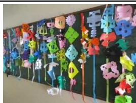
【1年 ちょきちょきかざり】