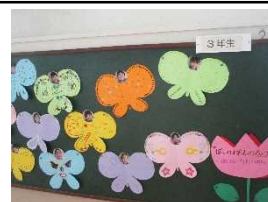
【3年 ぼくのわたしのちょうちょ】