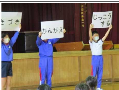
【JRC (青少年赤十字) 登録式！】

★前期の各委員会による「 児童総会 」が開催。子供が主体となって学校生活を運営する独自の活動です。