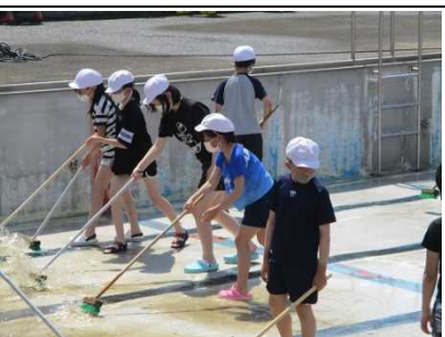
【磨く 磨く プール清掃！】

★今年から2年間、 JRCの研究推進 の県指定を受け、「 健康安全・奉仕・国際理解 」の活動に取り組んでいきます。