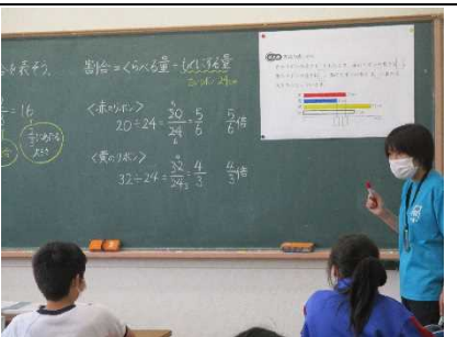
【算数の学習を悩ます 割合の学習へ！】

★6年 理科「からだのはたらき」 脈の測定から始まる 身体の血液や内臓の働き を調べています