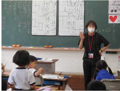
【言葉を紡いで 文を作ろう！】

プールの水面は初夏の光が眩しいほど照り返り、エメラルドグリーンの色合いが引き立ちます。思い返せば、昨年は臨時休校明けの学校を再開したばかりの頃でした。今は、感染症対策下ながらも通常の学校生活を送っています。今後は、高温状態が続くため、熱中症対策も講じていきます。子供たちの笑顔と元気を活力にして、村岡小学校は6月を乗り切っていきます。