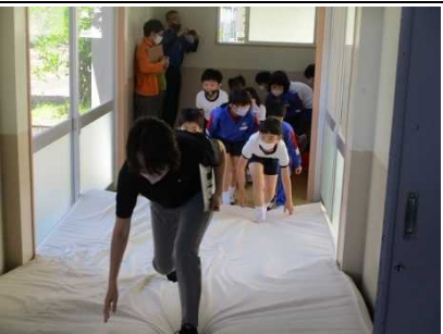
【避難訓練 備えあれば 憂いなし！】

★税務署の方から「 税金の仕組み 」の出前授業を受講。市民としての 基礎知識 を学びました。