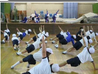
【体幹を鍛えて 元気アップ！】

★夏の中、5、6年生が緑色に染まったプール槽をブラシで徹底的に汚れを落としました。