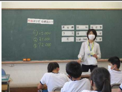
【6年生 シチズンシップ教育に臨む】

★毎週火曜と金曜の大休みの元気アップタイム。雨天時は ストレッチ を中心にした「 体ほぐし 」です。