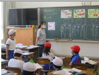
【道徳で人権教育を！】

★2年 生活「まちたんけん」 消防署や郵便局など 地域の施設訪問の手紙を作成 しました。