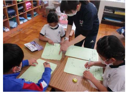
【地域の施設へ手紙を送ろう！】

★1年 体育「走の運動遊び」 新聞紙を落とさないように 速度を調整しながらの疾走 です。