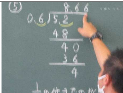
【わり算の壁を 乗り越えよう！】

★4年 社会「粗大ゴミのゆくえ」 粗大ごみのリサイクルやリユースを学び SDGsの教育を啓発 しています。