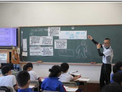
【動物のからだの働きを知ろう！！】

★5年 算数「小数のわり算」 少数同士を わり進んで四捨五入して概数 求める高レベルな計算技法です。