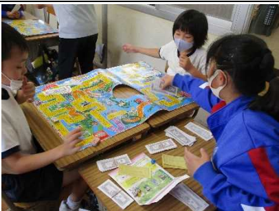
【ボードゲームで SDGs を学ぶ！】

★地震による校舎内の火災発生から グラウンドへ避難 する訓練を自主的に実施しました。