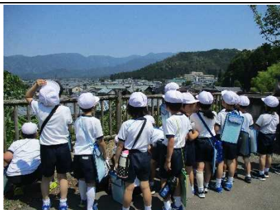
【2年生 長山公園で調査活動！】

★地域の公園の正しい使い方を知るために 実地調査 へ。身近な公園のあり方を目の当たりにします。