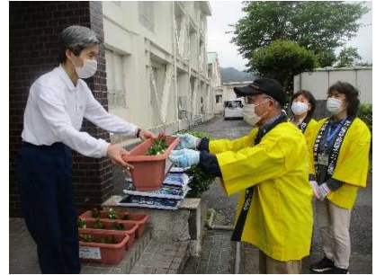
【人権の心の花を 咲かせます！】

★学年初めの授業参観を行い、 進級したばかりの各学年の学びの姿 を見ていただきました。