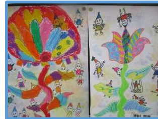
【上 4年生 魔法の花】