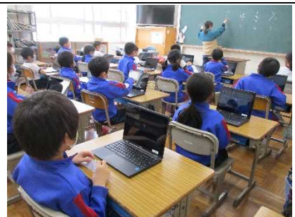
【タブレット端末は 全学年で！】

★毎週火・水曜日の大休みに行う体力づくり。長距離走やサーキット、大縄跳びで元気アップです。