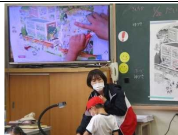
【1年生 ICT機器を使って！】

★生活科の「 学校大好き 」の学習で、村岡小学校に関するさまざまな質問に答えました。