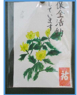
【6年生 ミチノククジュウの 絵はがき】