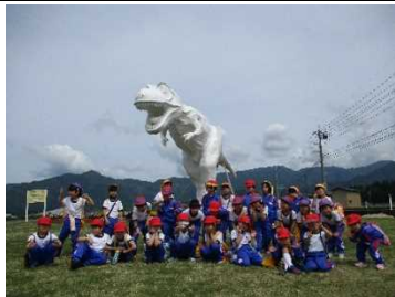
【ホワイトザウルスで 写生！】

★1年生が「村岡町のシンボル」の写生に挑戦。 個性あふれる恐竜の絵が完成 しました。