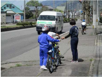
【路上で 自転車の実地練習！】

今月は、市内の小学校で新型コロナウイルスの感染が発生し、各学校は昨年のように緊急対応を迫られました。漸く緊急事態のレベルが引き下げられ、学校は緊急事態宣言前の生活に戻りつつあります。今後も子供たちの学習と生活を保障しながら日々の教育活動に取り組んでいきます。