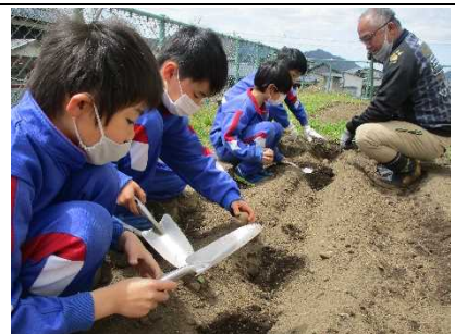
【学校菜園で 勤労生産活動！】

★6年生がシクワグジュウの観察と調査を行いました。 10年以上にわたる保全活動は続きます。