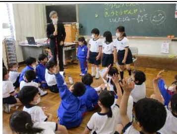
【1年生教室で インタビュー！】

★地図と画面で、 アナログとデジタルの良さを生かした情報収集と分析 を行います。