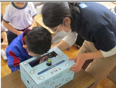
【1年生 手洗いの仕方を学ぶ！】

★感染症対策の一つである手洗い。 手の汚れの観察から正しい洗い方を 学び直しました。