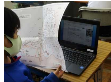
【4年生 タブレット端末で調べ学習！】

★2年生が案内役となって、1年生と一緒に 校舎見学 をしました。写真は校長室の様子です。