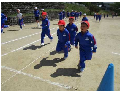
【元気アップタイム 始まる！】

★感染症対策の一つである手洗い。 手の汚れの観察から正しい洗い方を 学び直しました。