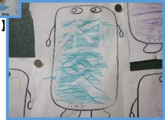
【右 1年生 でこぼこ はっけん】