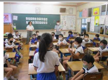
【3年生 初めての外国語活動！】

★ディスプレイに 大きく写して分かりやすく説明 。日常的な ICT機器の活用場面 です。