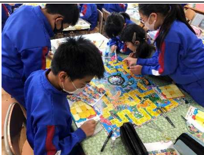
【人生ゲームで SDGsを学ぶ！】

★2年生が一人一台のタブレット端末の活用。まずは 基本操作から徐々に 学んでいきます。