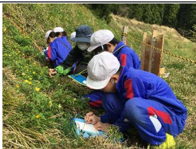
【シクワグジュウの 調査活動へ！】

★5年生がタカラトミー社との遠隔学習を通して人生ゲームを制作。ユニークな総合学習です。